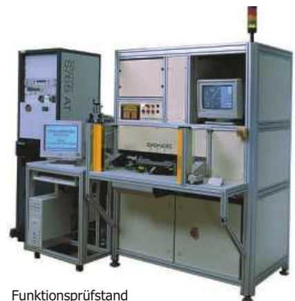
Funktionsprüfstand mit Bildverarbeitung für Kombiinstrumente im PKW Bereich

transporting positioning detecting mounting contacting testing comparing measuring marking