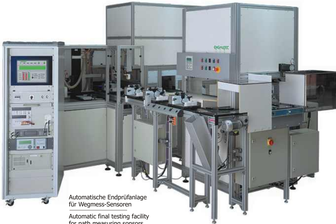
Automatische Endprüfanlage für Wegmess-Sensoren Automatic final testing facility for path measuring sensors