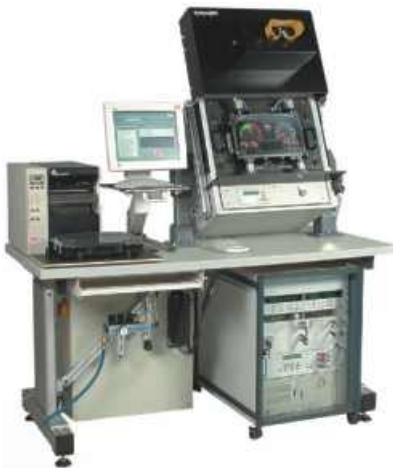
Funktionsprüfstand für Kombiinstrumente im Nutzfahrzeug-Bereich Function test facility for combined instru- ments for the commercial vehicle sector