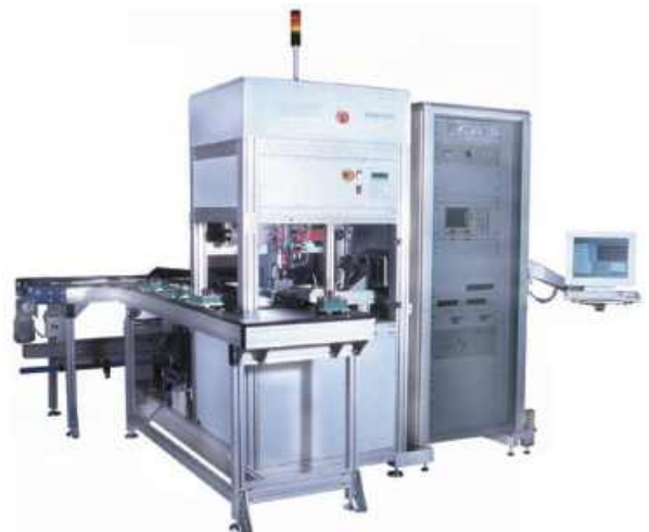
Funktionsprüfstand für funktechnische Module Function test facility for radio modules