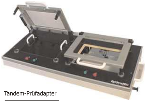
Tandem-Prüfadapter Tandem test adapter